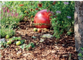
En paillage (p.7)

L'Agglomération du Bocage Bressuirais vous propose 1h de broyage gratuit (voir p.11)