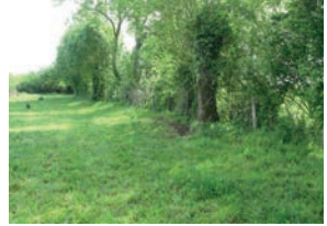
Les haies champêtres (p6)