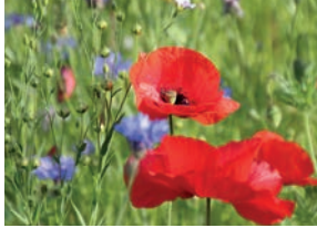
Les espaces de nature (p.5)