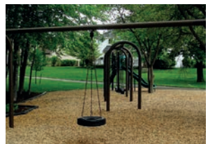
Autres utilisations : aménagement paysager, litière, allée de jardin... (p.9)