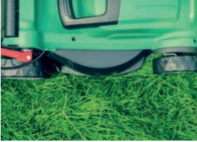
Le "mulching" ou broyage de pelouse lors de la tonte (p.4)

Les pratiques alternatives de jardinage :