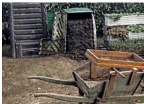
Dans le compost (p.8)