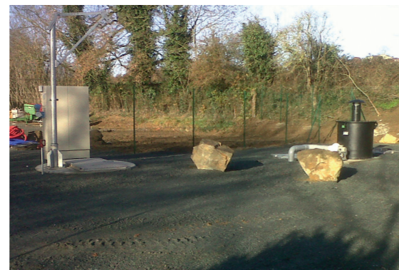
Bassin tampon enterré (ancien site)