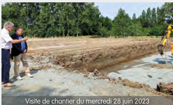
Visite de chantier du mercredi 28 juin 2023

Un investissement de 200000 € HT entièrement financé par l'Agglo.