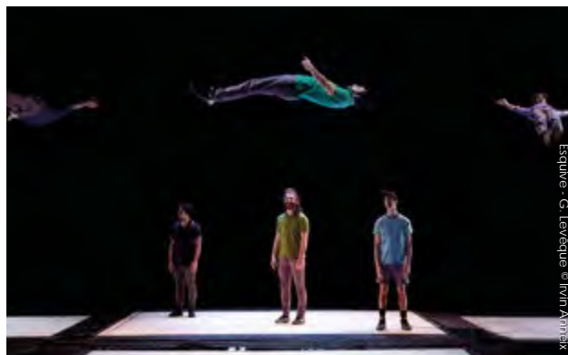
Esquive