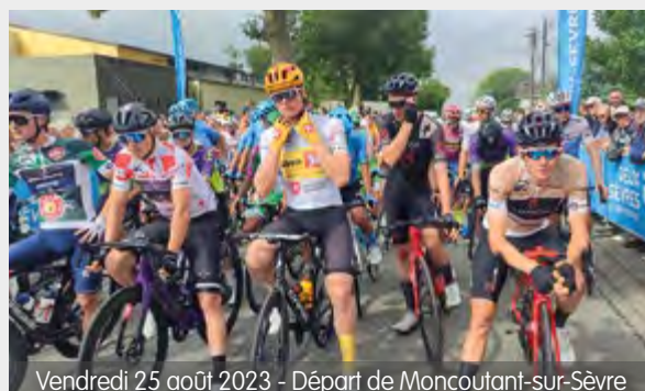
Vendredi 25 août 2023 - Départ de Moncoutant-sur-Sèvre