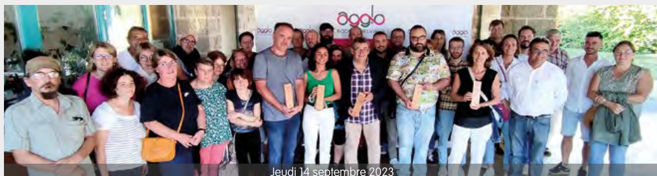
Jeudi 14 septembre 2023