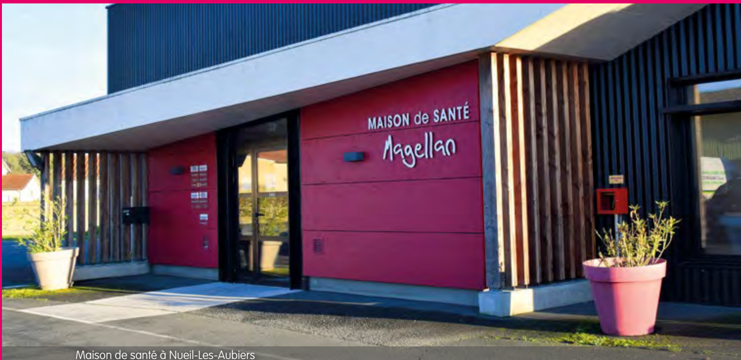
Maison de santé à Nueil-Les-Aubiers