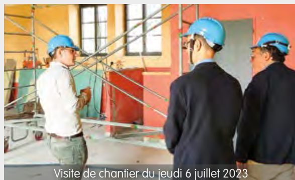
Visite de chantier du jeudi 6 juillet 2023

Pendant la durée des travaux, les services sont transférés au domaine de la Roche, aménagé par la ville pour l'occasion.