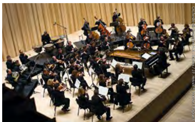
Orchestre de chambre N.A. - J. Heisser / J.F. Heisser et J. Heisser (chopuzot)