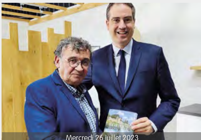
Mercredi 26 juillet 2023