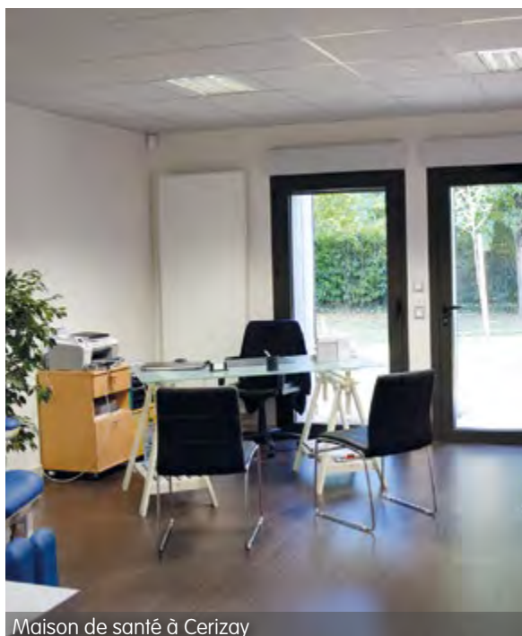
Maison de santé à Cerizay