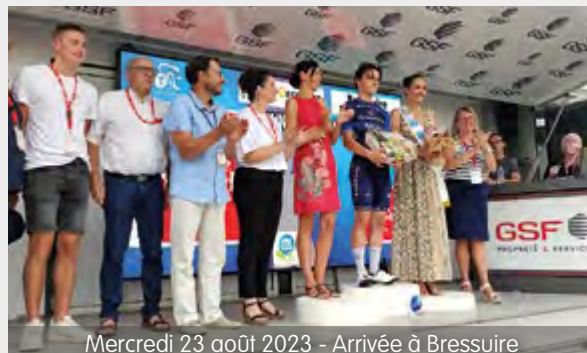
Mercredi 23 août 2023 - Arrivée à Bressuire

Vous avez été nombreux à vous réunir au bord des routes pour voir passer la caravane et soutenir les coureurs de cette 37 ème édition du Tour Poitou-Charentes lors des 2 étapes en Bocage Bressuirais. Victoire de Paul Penhoet - GroupamaFDJ à l'arrivée de la deuxième étape à Bressuire et de Marc Sarreau - AG2R Citroën Team qui s'impose sur la dernière étape au départ de Moncoutant-sur-Sèvre vers Poitiers.