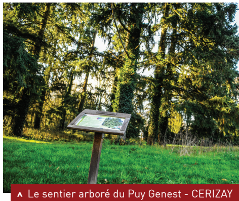
▲ Le sentier arboré du Puy Genest - CERIZAY