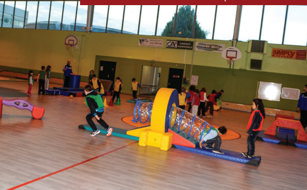
▼ Multi-accueil - MAULEON