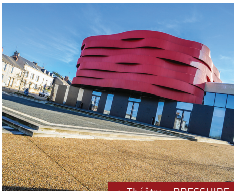
▲ Théâtre - BRESSUIRE