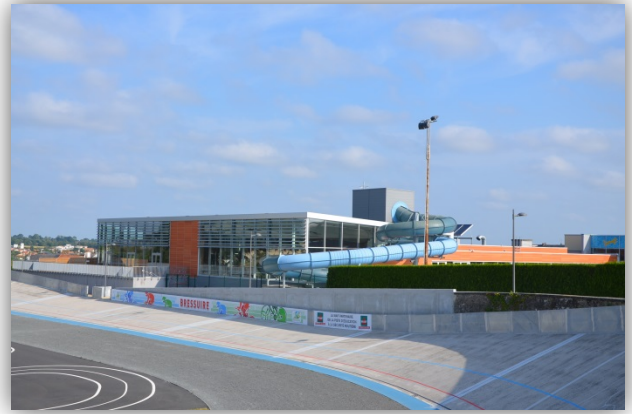
le centre aquatique, le vélodrome