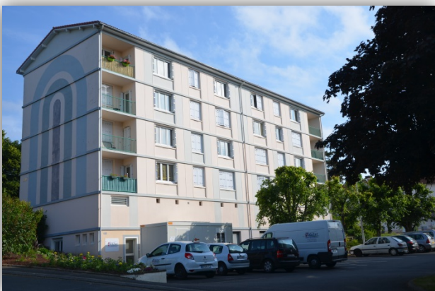
L'agence Habitat Nord Deux-Sèvres