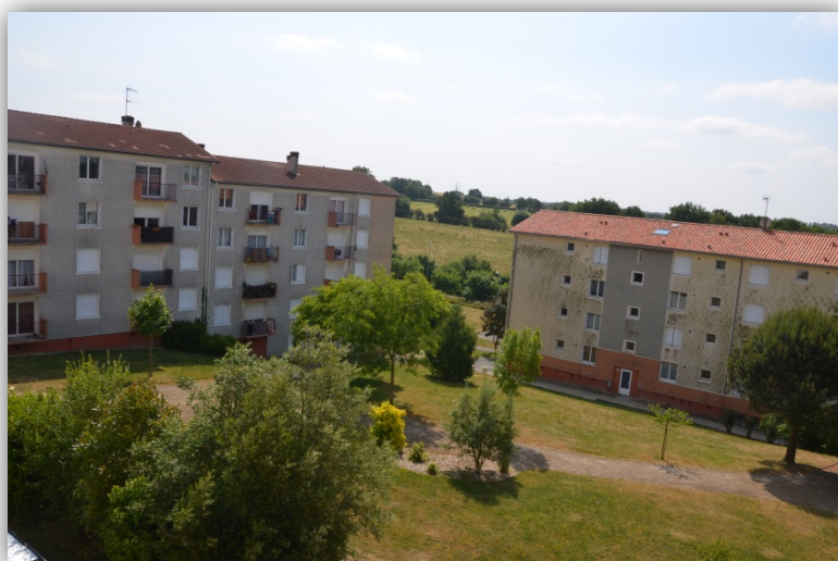
Le « carré » de la versenne