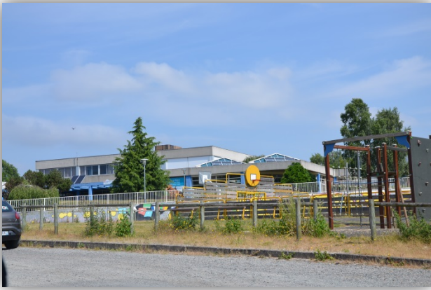
Le lycée Léonard de Vinci