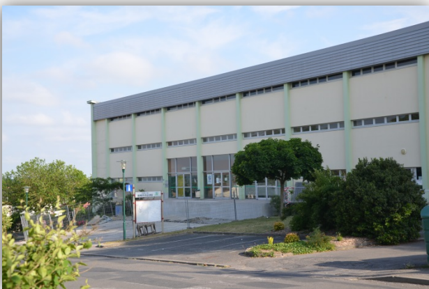
La salle omnisport