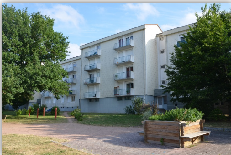
Square Jean Bousseau