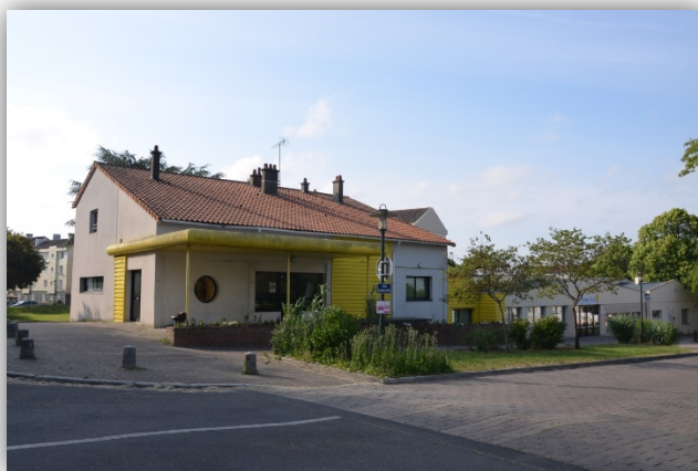
Le centre socio-culturel