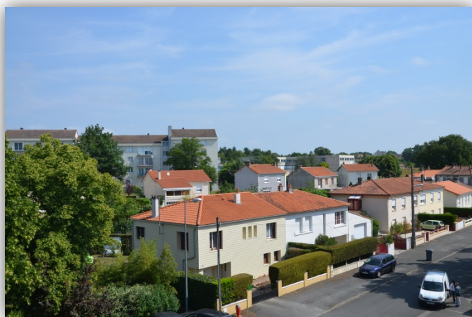
Habitats mixtes sur le quartier, collectifs/ individuels, publics/ privés