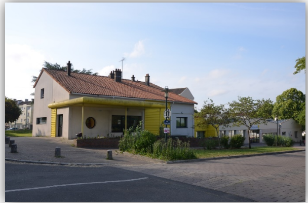
Le centre socio-culturel