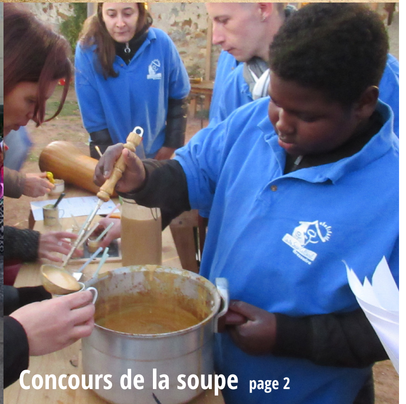
Concours de la soupe page 2