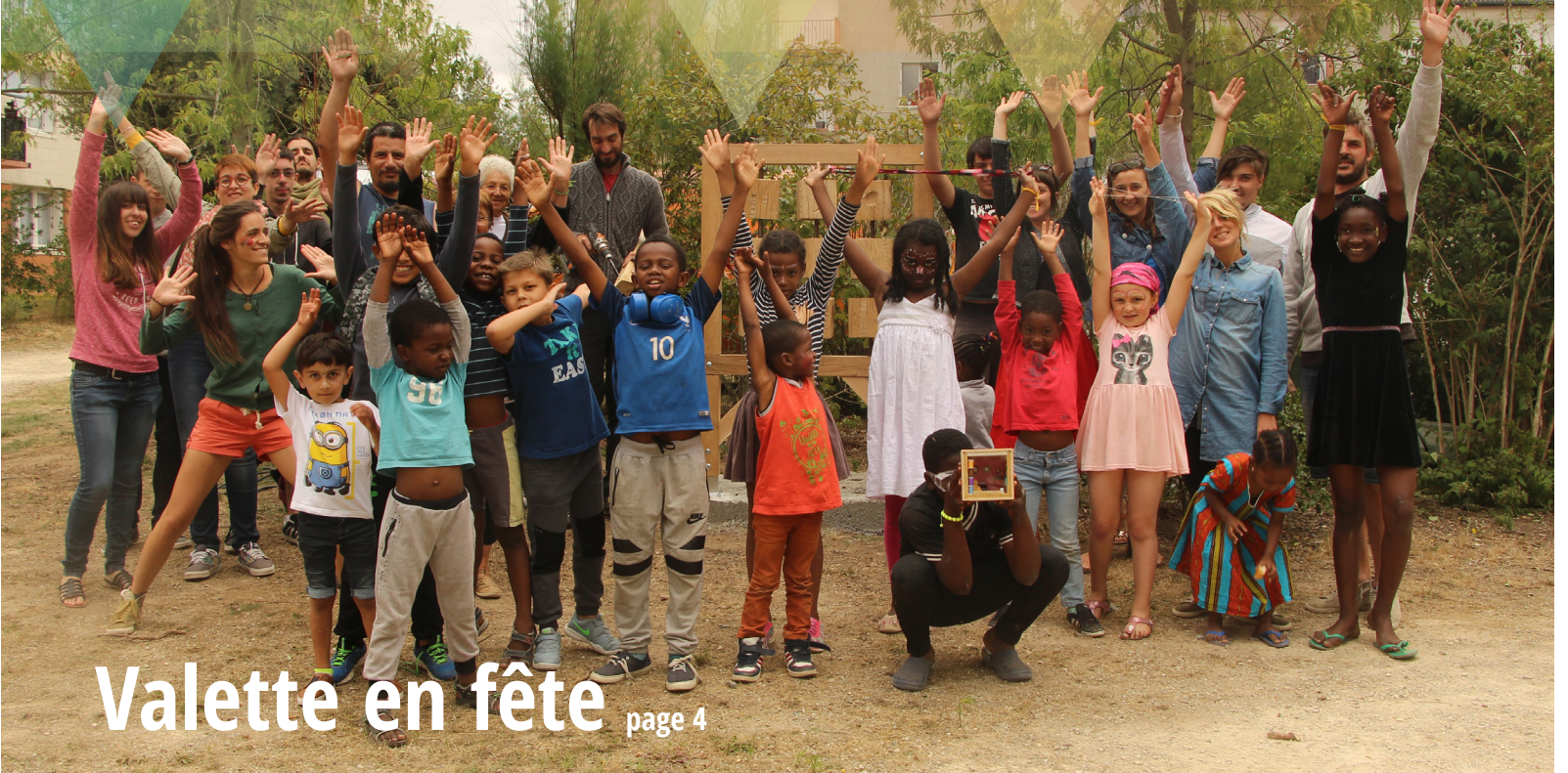
Valette en fête page 4