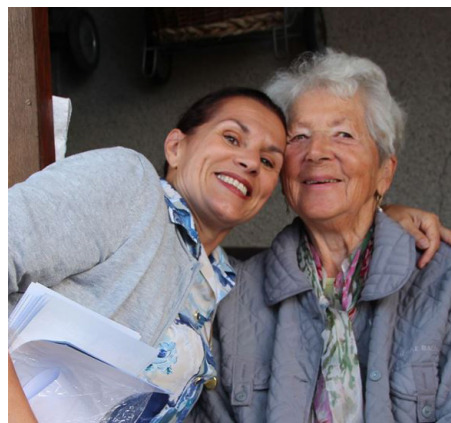
6 - 1001 VALEURS