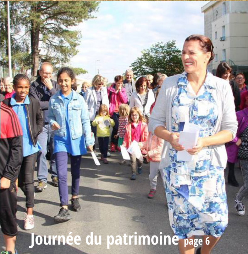
Journée du patrimoine page 6